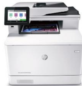
HP Color LaserJet Pro M479fnw

Dynamic-Security-fähiger Drucker. Ausschließlich für die Verwendung mit Patronen mit Original HP Chip vorgesehen. Patronen mit Chips anderer Hersteller funktionieren möglicherweise nicht oder in Zukunft nicht mehr. Weitere Informationen unter: