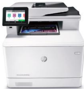
HP Color LaserJet Pro M479dw

Geschäftlich erfolgreich zu sein bedeutet, smarter zu arbeiten. Der HP Color LaserJet Pro MFP M479 ist so konzipiert, dass Sie Ihre Zeit auf eine effektive Unterstützung des Unternehmenswachstums konzentrieren können und gleichzeitig der Konkurrenz einen Schritt voraus sind.